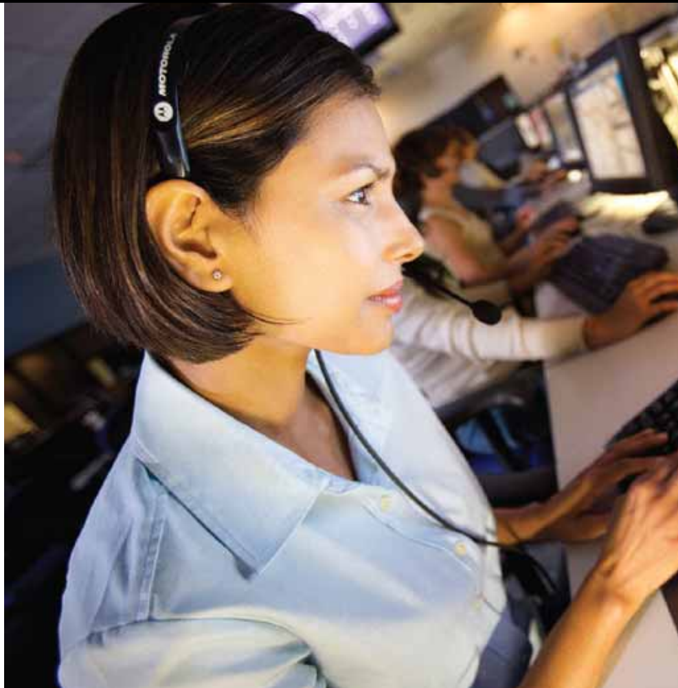
PMLN5096 Fone de ouvido em Forma de "D"

Estes acessórios de áudio são projetados para os coordenadores de serviço ao cliente onde projetar uma imagem profissional é tão importante quanto uma comunicação sem problemas e confiável.