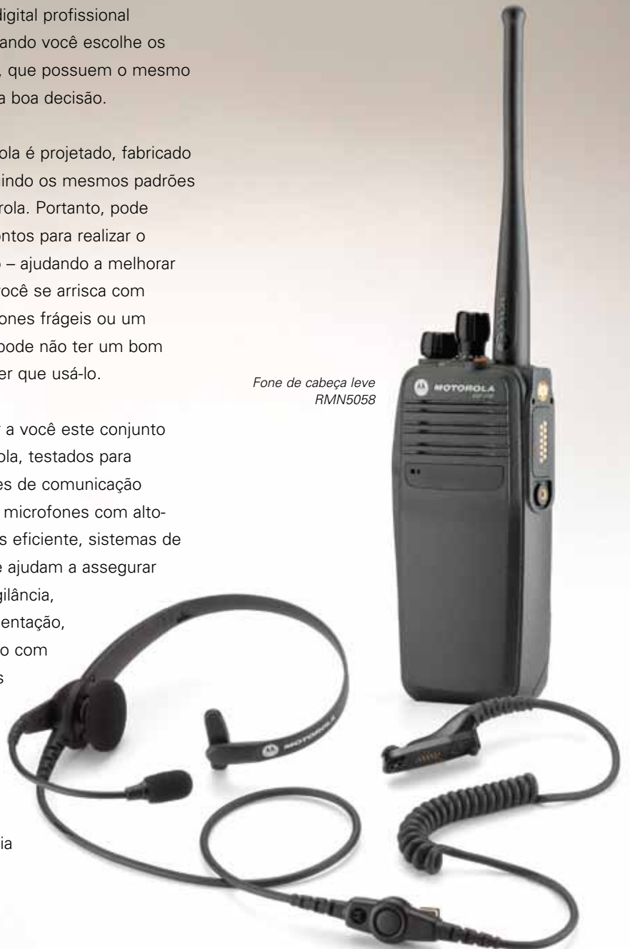
Fone de cabeça leve RMN5058

Temos o prazer de apresentar a você este conjunto de acessórios originais Motorola, testados para suas necessidades importantes de comunicação de negócios. Você encontrará microfones com alto-falantes para um controle mais eficiente, sistemas de fones de ouvido discretos que ajudam a assegurar a privacidade e auxiliam na vigilância, estojos que facilitam a movimentação, fones de cabeça para operação com mãos livres, baterias especiais para ampliar o tempo de funcionamento e muito mais. Todos os acessórios estão prontos para ajudá-lo a trabalhar de maneira mais inteligente, com mais eficiência e mais confiança.