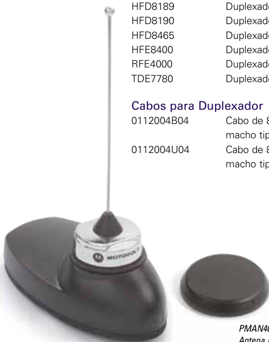
PMAN4000 Antena ativa de GPS com montagem fixa

Cabo para bateria de respaldo Cabo de 120V AC