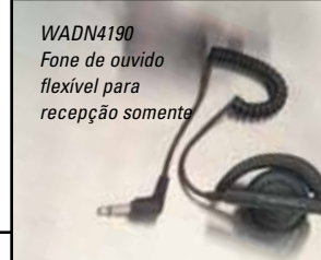
WADN4190 Fone de ouvido flexível para recepção somente