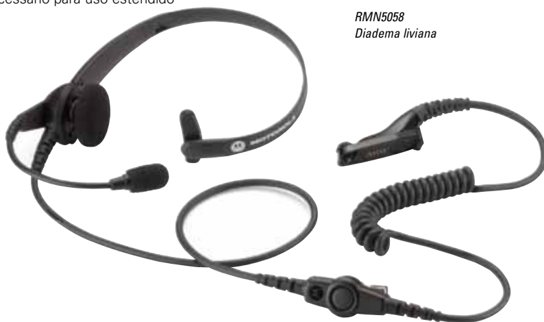
RMN5058 Diadema liviana