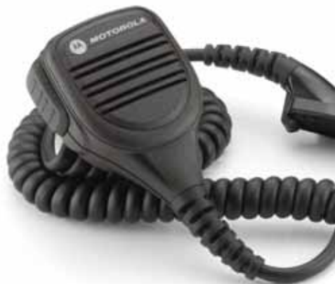
PMMN4025 Microfone falante remoto IMPRES™ com entrada de áudio de 3,5 mm