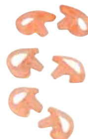
RLN4765 RLN4762 RLN4764 RLN4761 RLN4763 RLN4760

Da esquerda para a direita, de cima para baixo: