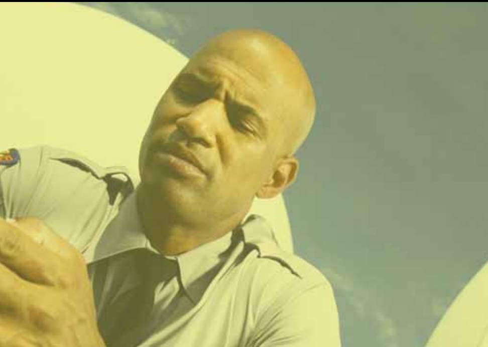
HLN6602 Colete Universal

Você ficaria surpreso com quanto tempo pode ser economizado quando um rádio está sempre no mesmo lugar, o que fica fácil através destas opções versáteis de acessórios para transporte originais Motorola.