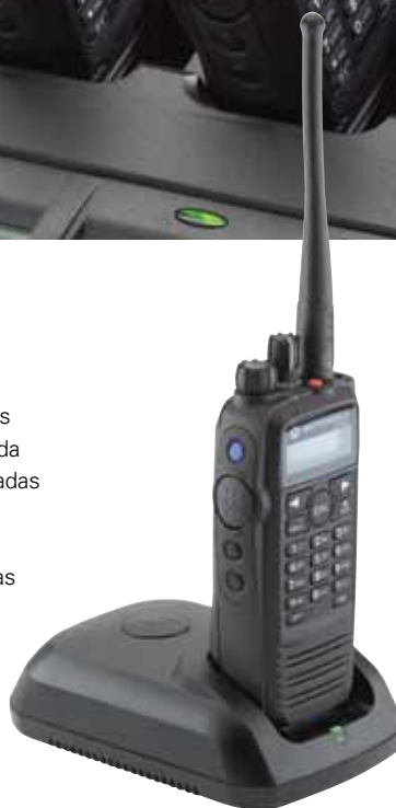
WPLN4232 Carregador individual IMPRES. Rádio não incluído.